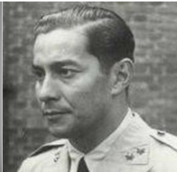
Sultan Hamid II

Selanjutnya sesuai dengan pesan dari Presiden Soekarno yang berbunyi “hendaknya lambang negara tersebut melambangkan pandangan hidup bangsa, dasar negara Indonesia atau ide Pancasila, beberapa anggota Panitia Lambang Negara lain juga ikut mencoba mengajukan berbagai usulan visualisasi simbol sila-sila Pancasila (Santoso, Aulia, Indah, & Lestari, 2023). Visualisasi ini mampu dipresentasikan dalam bentuk Perisai Pancasila yang dikenal seperti sekarang ini. Adapun visualisasi simbol sila-sila Pancasila yang dikemukakan oleh beberapa anggota Panitia Lambang Negara dapat dilihat di bawah ini: