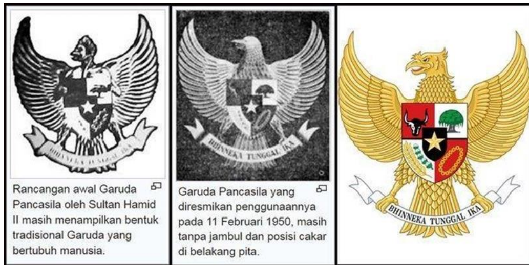
Gambar 2. Burung Garuda, dewa atau Elang Jawa