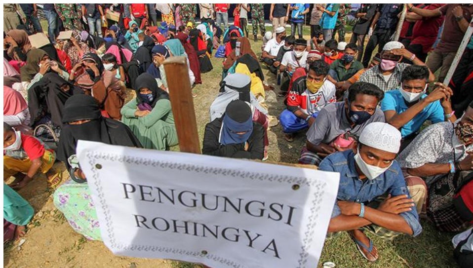
Gambar 4. Pengungsi Rohingya