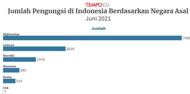
Gambar 2. Jumlah Pengungsi di Indonesia pada tahun 2021