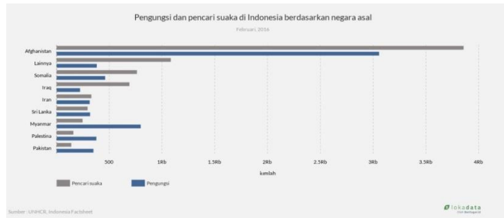
Gambar 1. Pengungsi dan pencari suaka di Indonesia berdasarkan negara asal